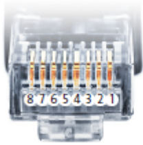
Belegung RJ45 Ethernet-Patchkabel

SmartDog® hat ebenfalls eine RJ45-Buchse für den Netzwerk-Anschluss. Wechselrichter nur über Bus 1 oder Bus 2 anschließen! Das Gerät kann bei Anstecken der Wechselrichter an die Ethernet-Schnittstelle zerstört werden!