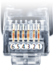
Belegung RJ12 Ethernet-Patchkabel