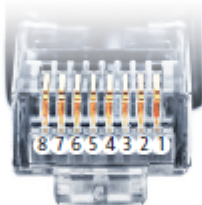
Belegung RJ45 Ethernet-Patchkabel

Einige Solar River Modelle Verwenden die selben Anschlüsse wie Solar Lake. Ist dies der Fall so muss wie Solar Lake vekabelt werden.