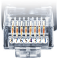
Belegung RJ45 Ethernet-Patchkabel

SmartDog® hat ebenfalls eine RJ45-Buchse für den Netzwerk-Anschluss. Wechselrichter nur über Bus 1 oder Bus 2 anschließen! Das Gerät kann bei Anstecken der Wechselrichter an die Ethernet-Schnittstelle zerstört werden!