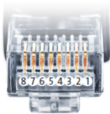
Belegung RJ45 Ethernet-Patchkabel

SmartDog® hat ebenfalls eine RJ45-Buchse für den Netzwerk-Anschluss. Wechselrichter nur über Bus 1 oder Bus 2 anschließen! Das Gerät kann bei Anstecken der Wechselrichter an die Ethernet-Schnittstelle zerstört werden!