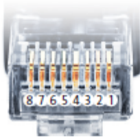
Belegung RJ45 Ethernet-Patchkabel

SmartDog® hat ebenfalls eine RJ45-Buchse für den Netzwerk-Anschluss. Wechselrichter nur über Bus 1 oder Bus 2 anschließen! Das Gerät kann bei Anstecken der Wechselrichter an die Ethernet-Schnittstelle zerstört werden!