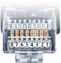
Belegung RJ45 Ethernet-Patchkabel

SmartDog® hat ebenfalls eine RJ45-Buchse für den Netzwerk-Anschluss. Wechselrichter nur über Bus 1 oder Bus 2 anschließen! Das Gerät kann bei Anstecken der Wechselrichter an die Ethernet-Schnittstelle zerstört werden!