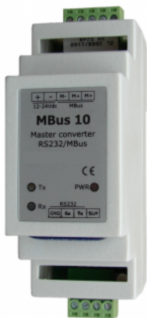
M-Bus 10 Wandler Serial/RS232 auf M-Bus