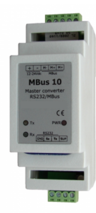
M-Bus 10 Wandler Serial/RS232 auf M-Bus